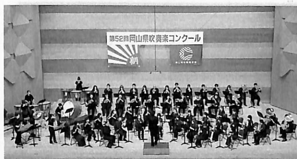
第52回 岡山県吹奏楽コンクール